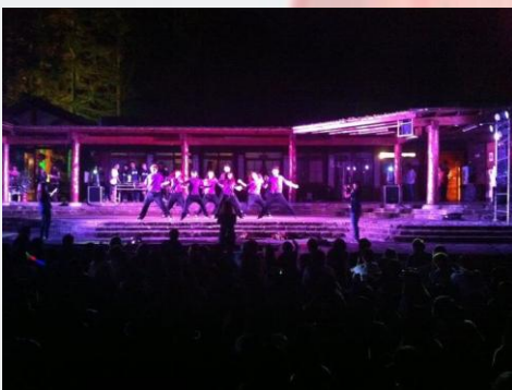
迎新宿營中，high到最高點的舞會時間