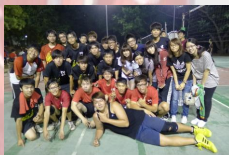
新生盃排球賽， 男子排球隊拿下全校第一名