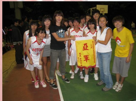
新生盃女子籃球賽，獲得第二名的好成績