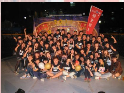
新鮮人化裝晚會， 拿下精神總錦標第一名的佳績