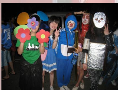
新鮮人化裝晚會， 同學們精心打扮的表演服飾