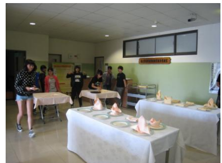
觀光系 折口布大賽名次表