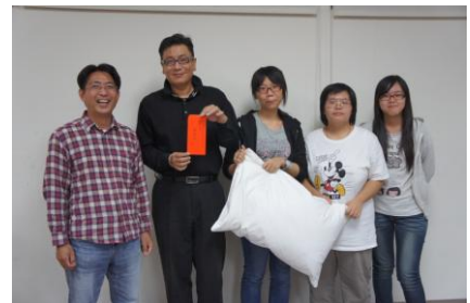
觀光系 枕頭大戰名次表

希望透過此次的校內競賽，讓同學熟悉餐旅服務丙級技術士考照之設桌項目中，各式口布款式的折法，床務項目中，床務整理方法與程序；並邀請業界服務的系友返校指導學弟妹，以評審的角度進行比賽的評分，增添了活動的緊張與刺激性，也讓畢業的學長姐重返校園，與系上相互連結，發揮觀光系傳承的精神，帶領在校的學弟妹一同提升自我的觀光專業能力。