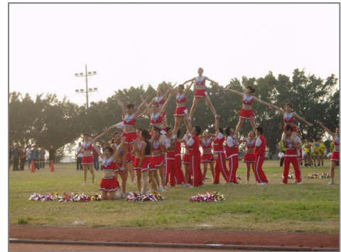
啦啦隊比賽的精彩照片