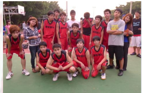
新生盃男子籃球隊的堅強陣容

近期有很多精彩的學生活動，包含充滿活力與回憶的迎新宿營、青春熱血的新生盃球賽、讓大一新鮮人深入了解世界風情畫晚會的世風說明會、以及新鮮人化裝晚會等，讓靜宜觀光系好動的學生們，散發熱情與活力。並在成績上，也有不錯的表現，拿下新生盃男子排球第一名，女子籃球賽第二名，新鮮人化裝晚會精神總錦標第一名的佳績，替系上爭取最高的榮譽。