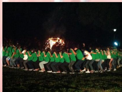
迎新宿營中，營火晚會的遊戲「椅子拿來坐」